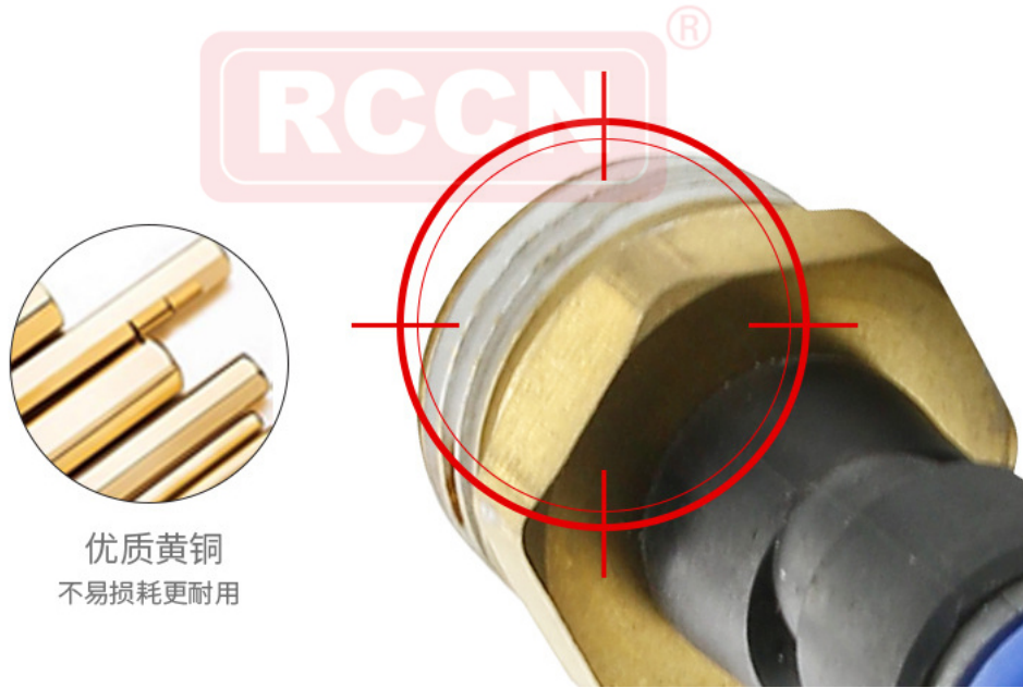
优质黄铜 不易损耗更耐用